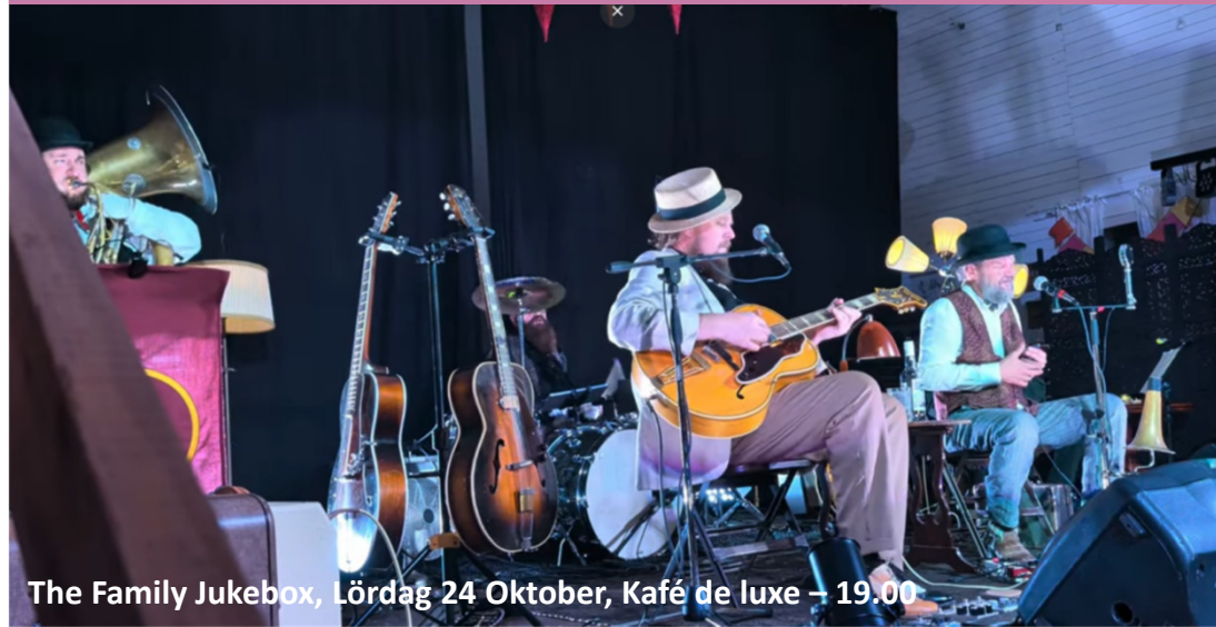
The Family Jukebox, Lördag 24 Oktober, Kafé de luxe – 19.00