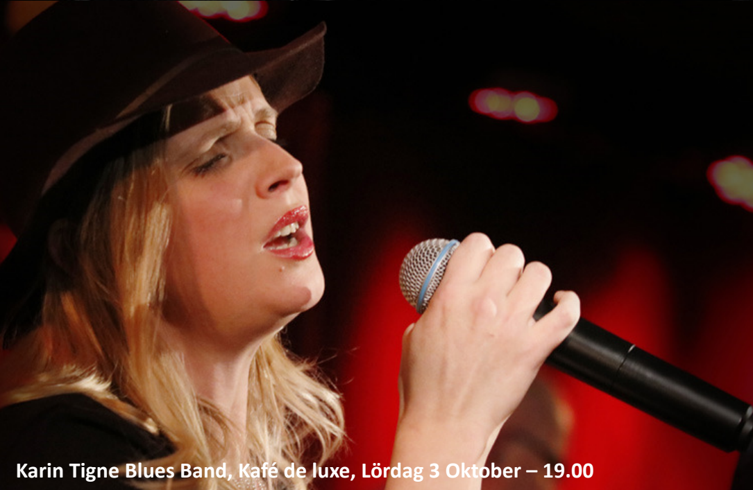
Karin Tigne Blues Band, Kafé de luxe, Lördag 3 Oktober – 19.00